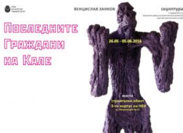
Изложба-скулптура на Венцислав Занков

Роден (Гражданите на Кале) като разширява смисъла ѝ - предаването на Ключа на Крепостта става метафора за съвременната ситуация в Европа.