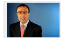
Директ обител напуска за да ... 23 апр. 2

Прогнозата за времето е любезно предоставена от WEATHER UNDERGROUND