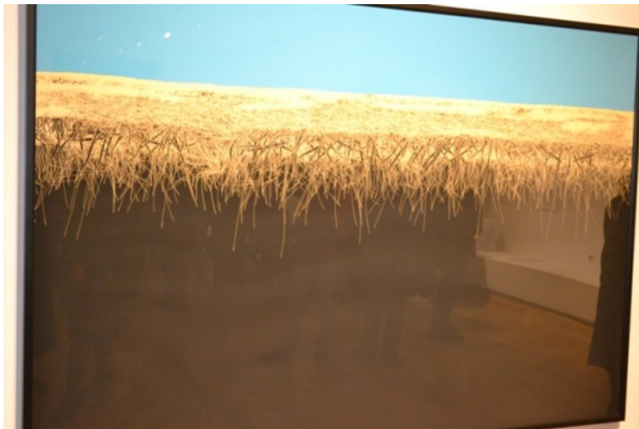
“Земна светлина” от изложбата в Софийска градска художествена галерия