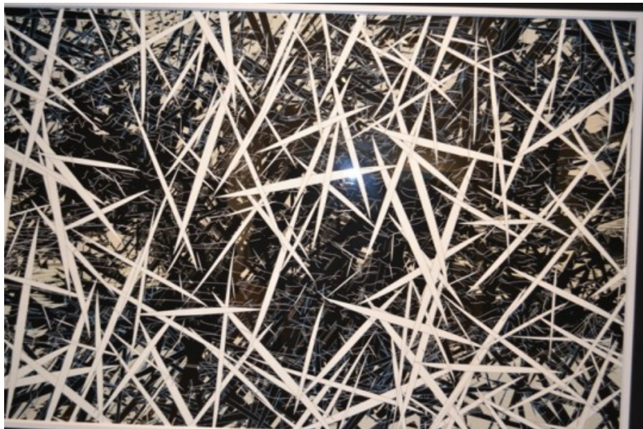
"Видение" от изложбата в СХГ