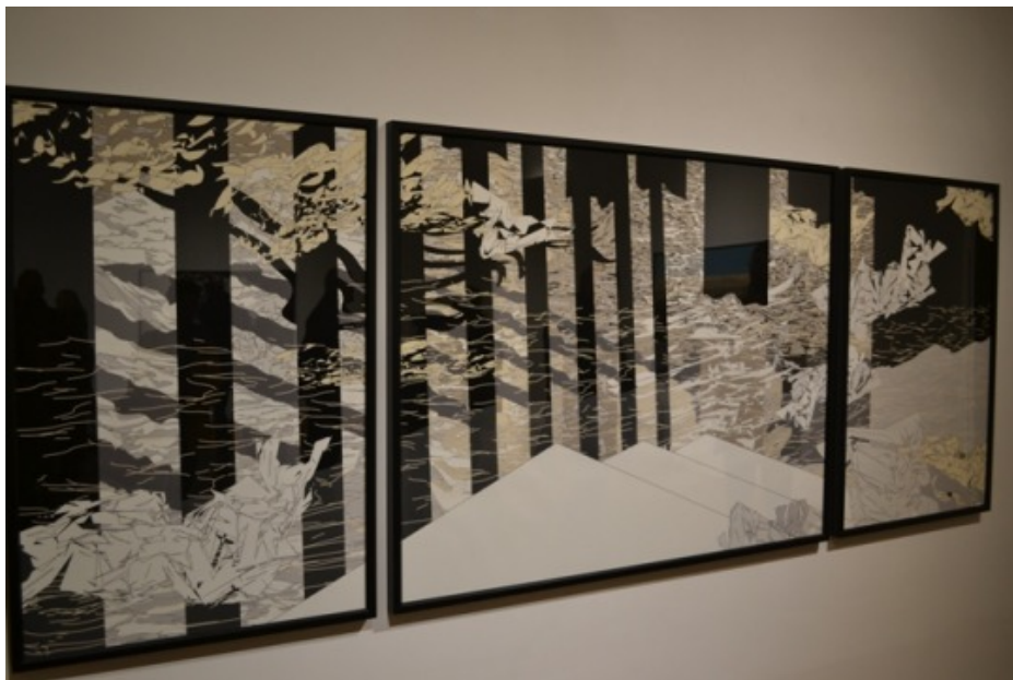
“Тялото на Орфей” от изложбата “Последен репортаж” в СГХГ