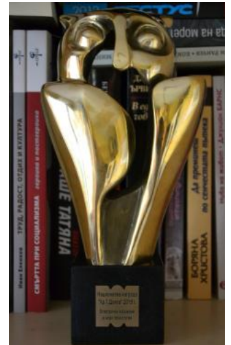
"Въпреки.com" е носител на Национална награда "Хр. Г. Данов" за 201!