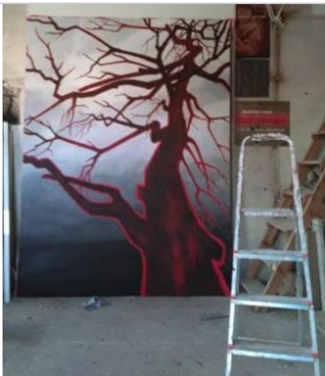
Фрагменти от изложбата "Пред мен" на Венцислав Занков