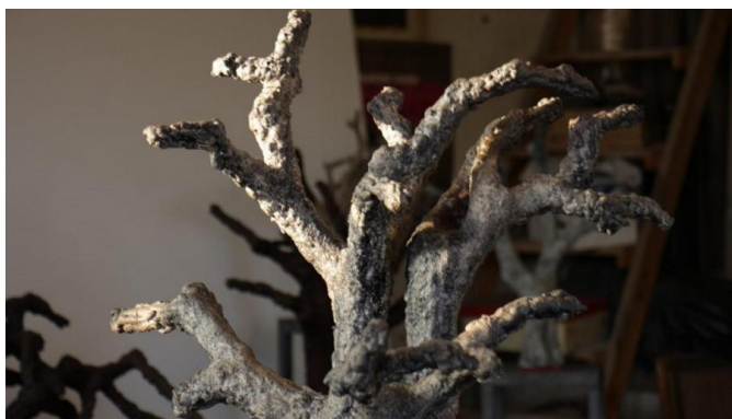
Част от изложбата "Пред мен"