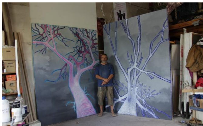
Фрагменти от изложбата "Пред мен" на Венцислав Занков

Един от тях е този на доц. Венцислав Занков.