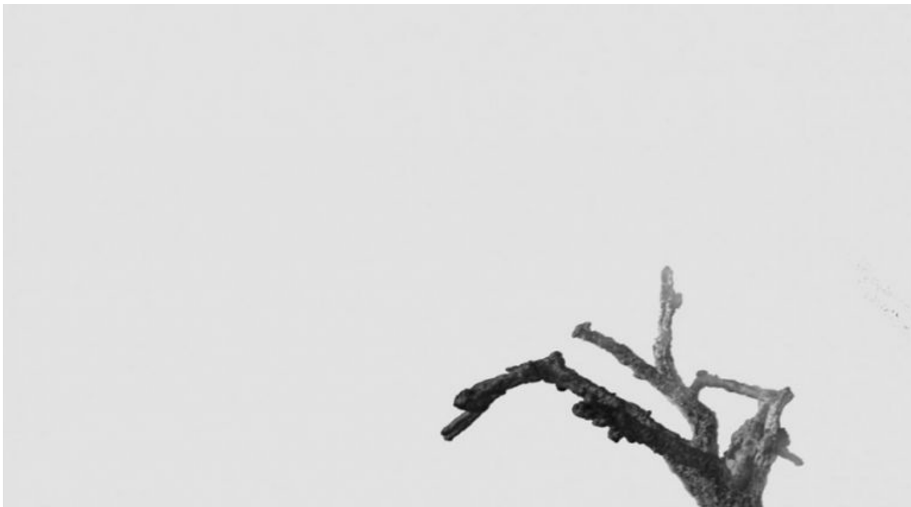
Пред мен, Изложба на Венцислав Занков (Галерия "Райко Алексиев")

Заглавието "Пред мен" остава отворено: стои (вече!) пред мен или предстои? Зададени едновременно.