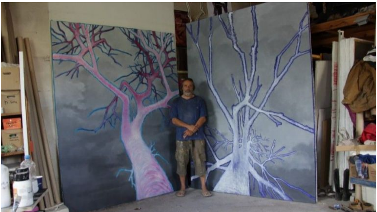
Пред мен, Изложба на Венцислав Занков (Галерия "Райко Алексиев")

© РЕДАКТОР: IMPRESSIO ( HTTPS://DIR.BG/AUTHOR/IMPRESSIO ) / 5 ЮНИ 2020 / 15:08 👁 270 ПРОЧИТА 🗨 0 КОМЕНТАРА ( HTTPS://IMPRESSIO.DIR.BG/COMMENTS/SRUTENOTO-BITIE-PREZ-POGLEDA-NA-EDIN-HUDOZHNIK )