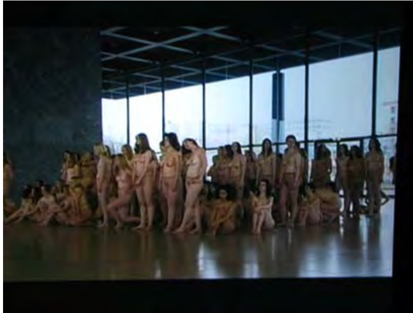
снимки през съклото на мазето, където се прожектира видеото от vb55, Neue Nationalgalerie Berlin, 2005