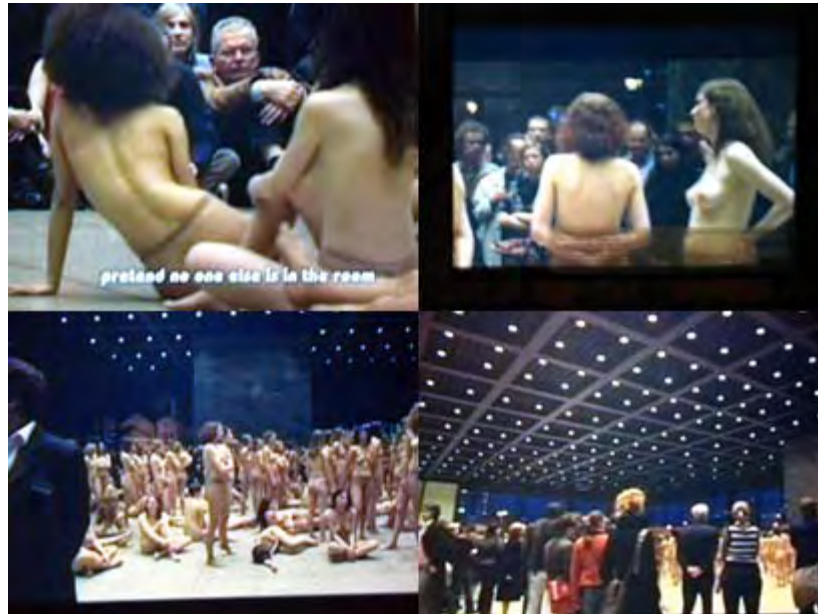
Оголени жени и публика снимки през съклото на мазето, където се прожектира видеото от vb55, Neue Nationalgalerie Berlin, 2005