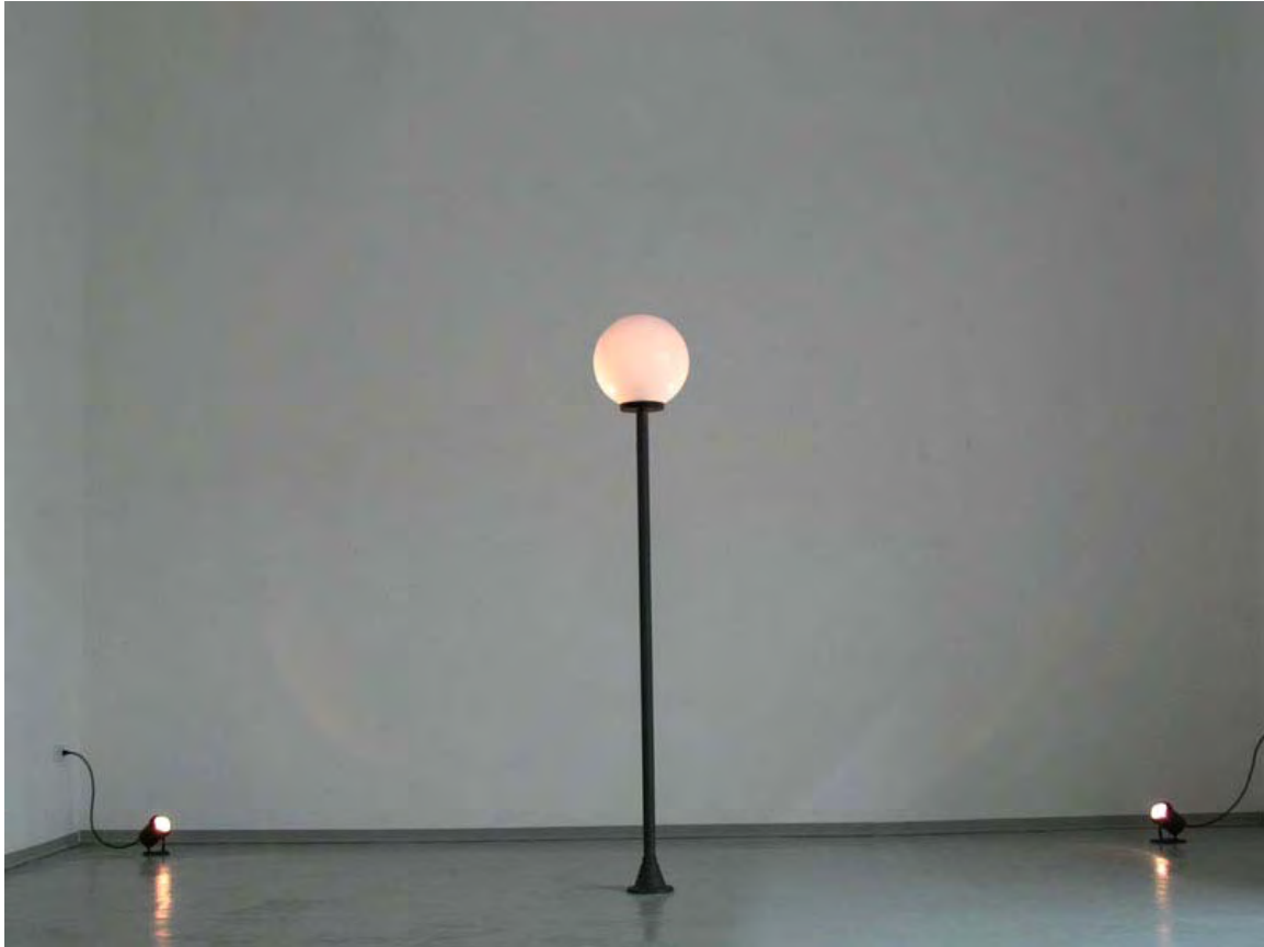
Лампата на Иво Мудов