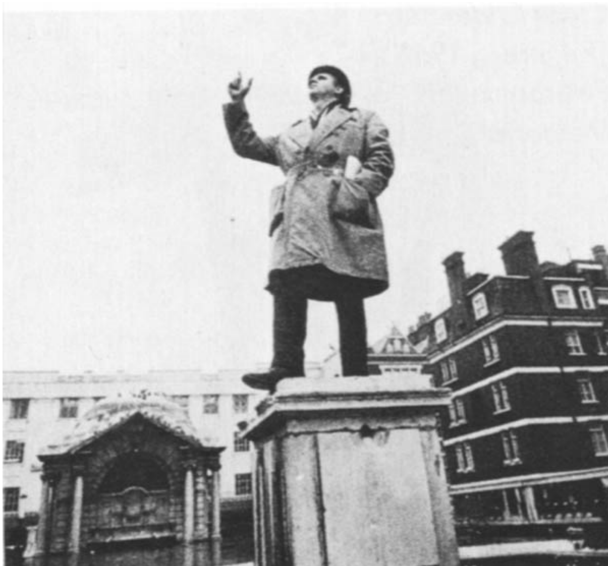
Claes Oldenburg като жива статуя близо до Grosvenor Square [площад в Лондон], 1965

Спирам се. Не съм вече сигурен, че трябва да пиша за неща, които са под прага на разбиране на среднообразован зрител. Обидно е някак си да бъдеш правен на идиот. Ако си спомняте една скулптура на работник и колхозничка, държащи сърп и чук с автор Вера Мухина се появяваше в началото на всяка кинопродукция на МосФилм. Трудно е да изброим колко и по какви начини след промените тя е ползвана интерпретирана. Днес в галерията ARC можете да видите отново поредната вариация — съвременен младеж вместо чук държи GSM, девойката, вместо сърп — банан. То дори не е и смешно - тъп виц или недоцялана иронията, в която трябва да се разпознае безкрайно очевидното — животът днес - и това трябва да е някаква съвременна критика на общество, консумация и т. н.