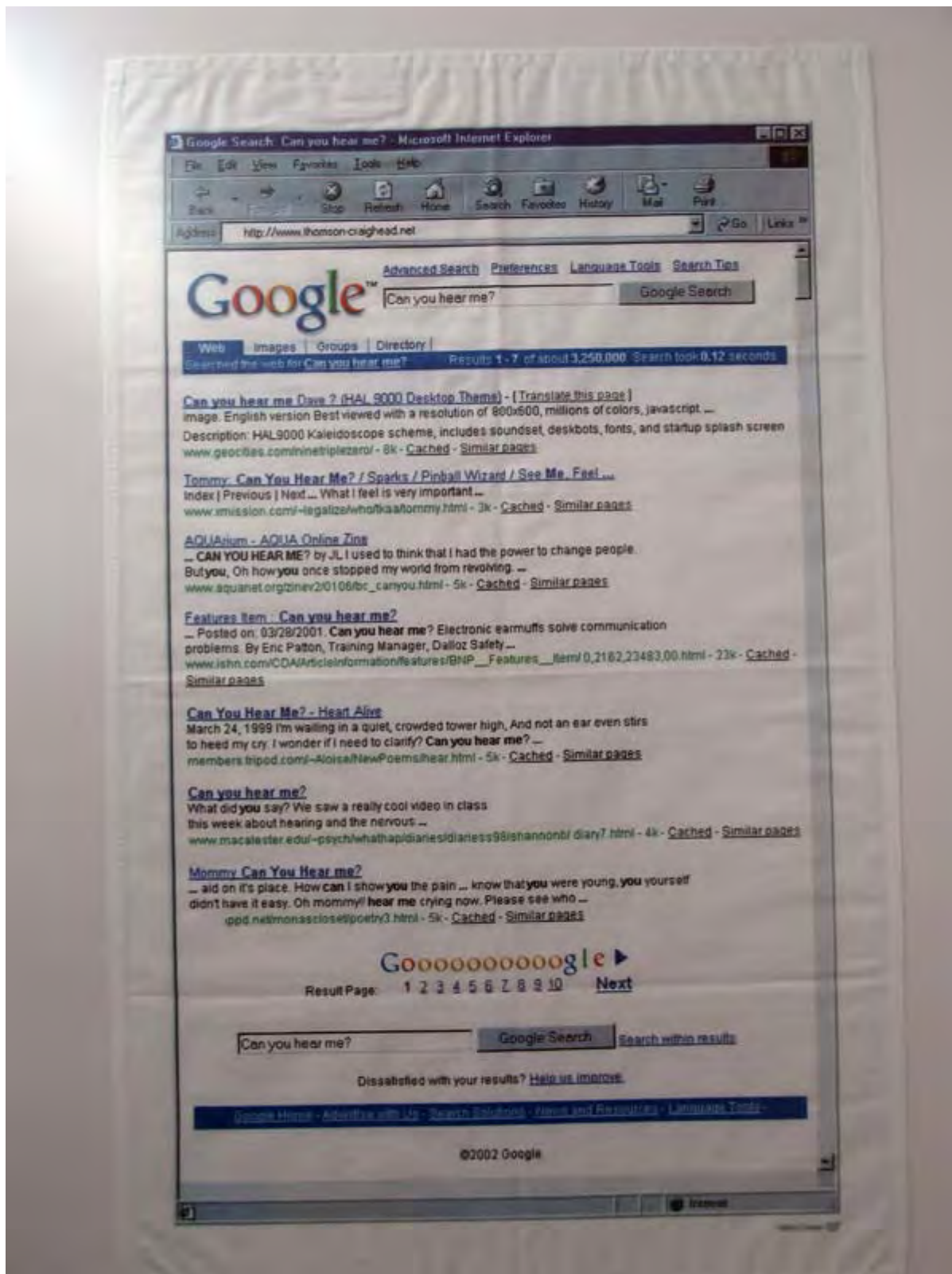
Google Tea Towels, 2002 – част от портфолио от 4 сито-печата върху памук.

Отгук започва /за мен/ интересното. Представям си ролята на тези кърпи — най-вероятно са на масата и чинийката и чашата с чай се слага върху тях. Не се сещам в момента да български как се наричат тези неща. Ясно е, че са памучни и освен функционалността трябва да внасят уют, комфорт и красота в общуването. Това, което виждам като украса на кърпата за чай, са първите 10 резултата при търсене в Google. Търсене на /отговор на / въпроса ‘Can you hear me’ и ‘Are you here’. Поставянето под въпрос на въпроса за чуваемостта и присъствието в съвременното общуване и неговите нови ритуали, наложени от комуникационните технологии; търсенето на помощ в технологията за намиране на най-валидните отговори, търсенето на изход от кризи в споделянето или липсата на такова или търсене на пълноценно присъствие – търсенето в Гугъл