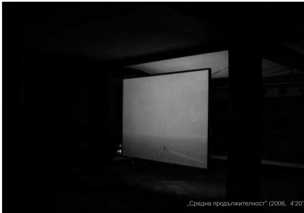
„Средна продължителност“ (2006, 4'20")