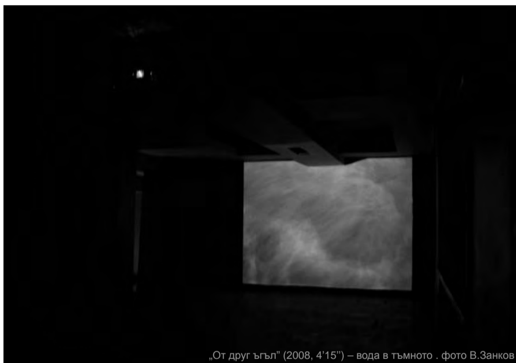
„От друг ъгъл“ (2008, 4'15") – вода в тъмното .