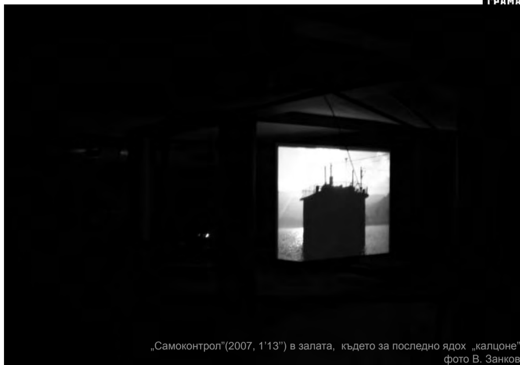
„Самоконтрол“(2007, 1'13") в залата, където за последно ядох „калцоне“