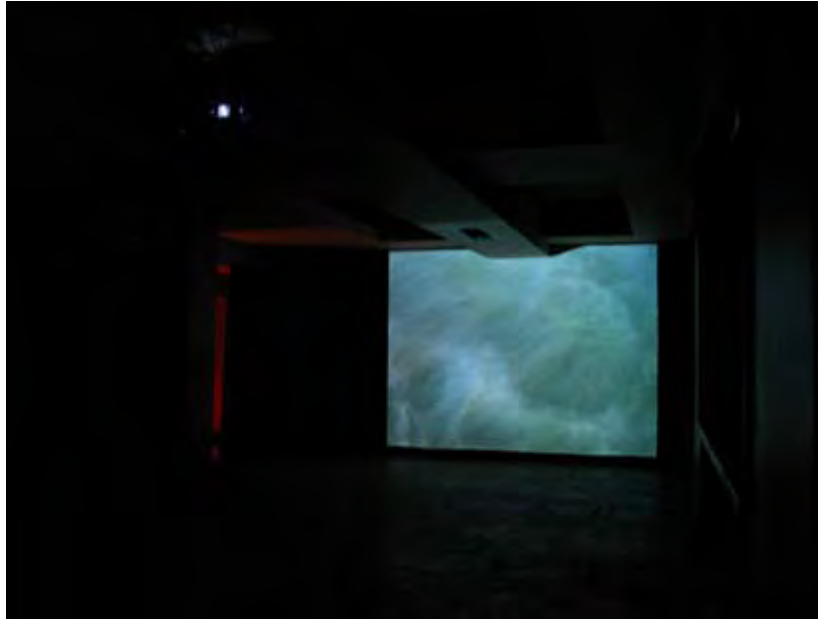
„От друг ъгъл“ (2008, 4'15'') – вода в тъмното .

Умерен оптимизъм – или невъзможната възможност да притежаваш собствения си живот. Светлината в мрака и 4 видеотворби на Надежда Олег Ляхова през пролетта на 2008-ма. Сентименталността ни трябва.