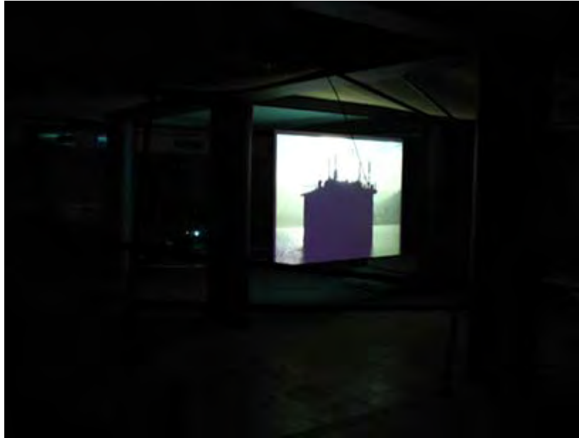
„Самоконтрол”(2007, 1'13”) в залата, където за последно ядох „калцоне”

Нов електронен магазин за маркова компютърна и офис техника! www.pcshop.bg