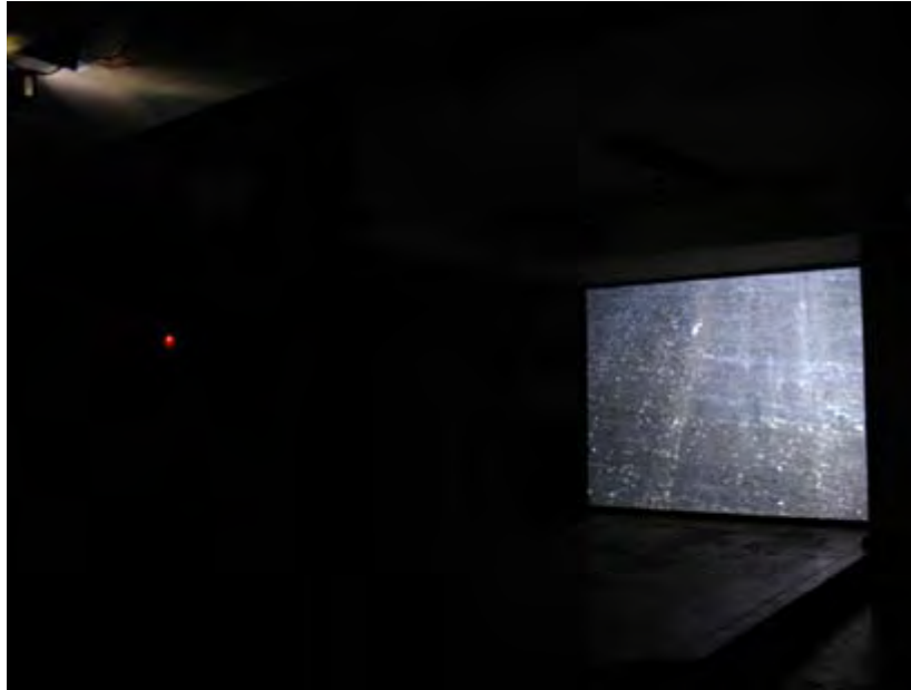
„Умерен оптимизъм” (2007, 4’30”) – прожекция върху черна стена